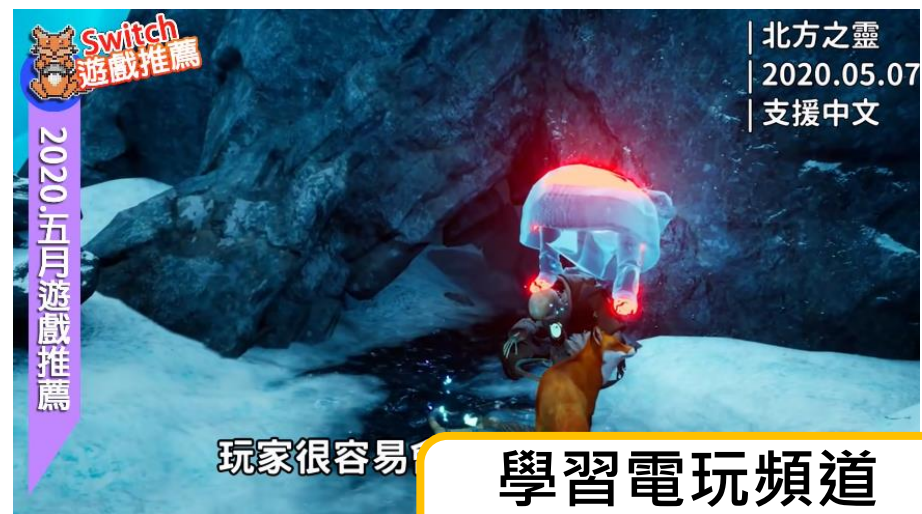
學習電玩頻道 介紹遊戲產品